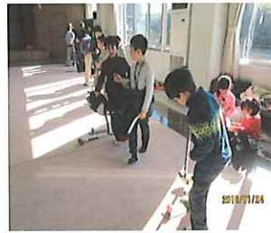
【グランドゴルフの様子】