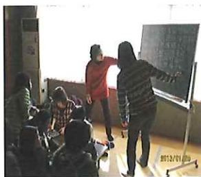
【ビンゴゲームの様子】